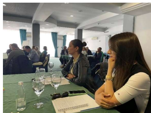
Слика 32 и 33 – Учество на обуки за усовршувања на тимот на ЦеПроСАРД