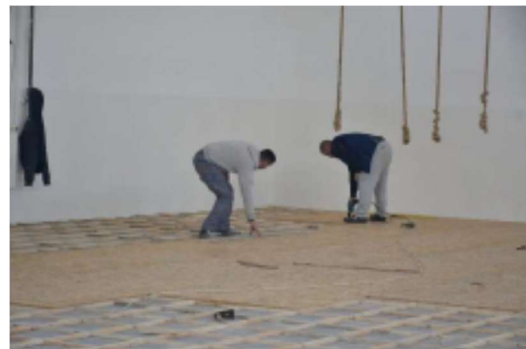
Слика 16 – Мерки за подобрување на ЕЕ - спортската сала во средното училиште „Коста Сусинов“ во Радовиш