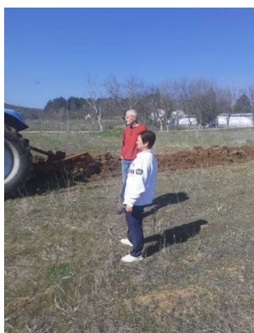
Слика 3 – Дел од терапевтските активности во воспоставените станбени единици за живеење со поддршка во заедницата од страна на проектот – март 2023