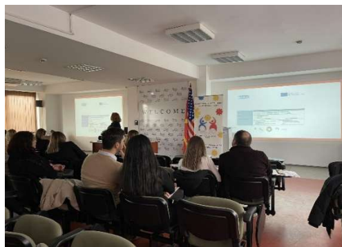
Слика 2 - Промоција на проектот во редурисен центар „д-р Златан Сремец“ на настан во рамки на проектот Adapted Accessibility for ALL – февруари 2023