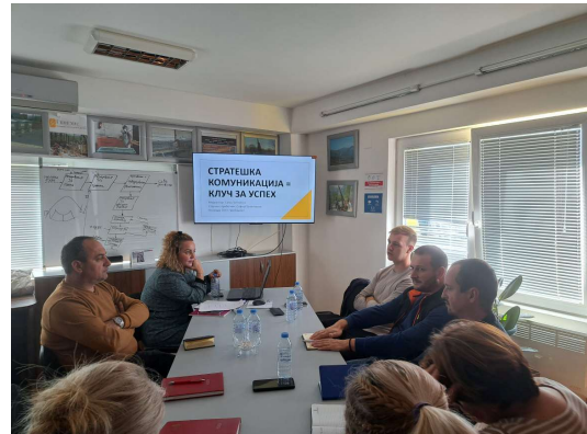
Слика 27 - Обука во просториите на „Силген Ресурсис Интернешнл“ ДОО Пробиштип