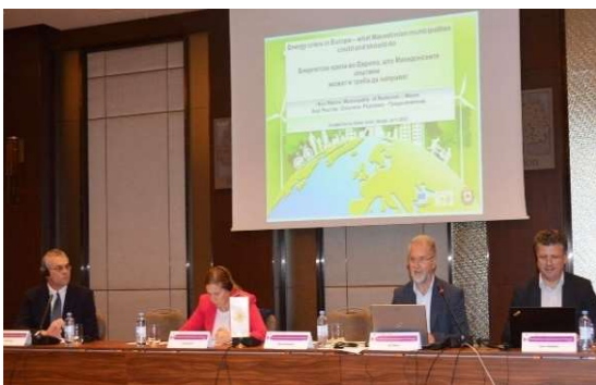
Слика 30 -Промотивен настан по проектот Зелена топлина