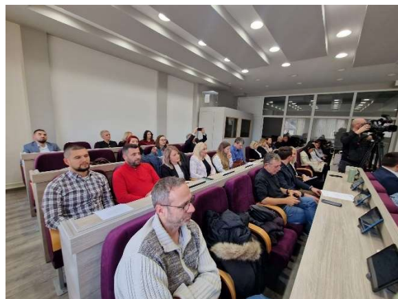
Слика 19 и 20 – Информативен Настан во општина Медвеца