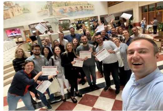
Слика 34 - 37 – Учество на промотивни настани и обуки за усовршувања на тимот на ЦеПроСАРД