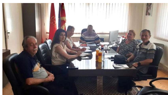
Слика 11 - Средба со претставници на од локалната самоуправа – општина Крушево