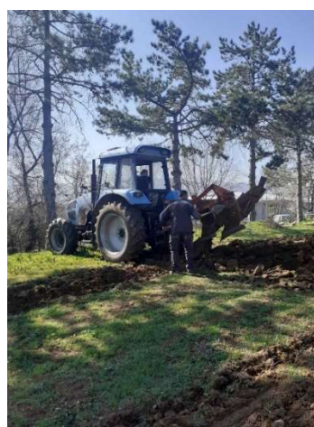
Слика 3 – Дел од терапевтските активности во воспоставените станбени единици за живеење со поддршка во заедницата од страна на проектот – март 2023 Деланданс во ЈУ СЗД