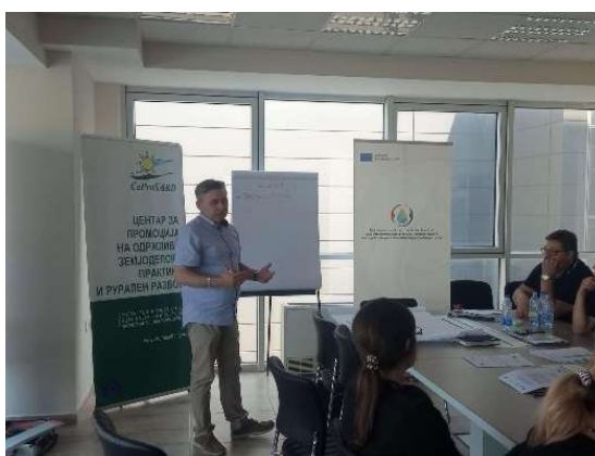
Слика 23 – 26 – Работилници за медиуми вода, воздух, почва, природа и биодиверзитет и отпад, одржани во просториите на општина Ѓорче Петров