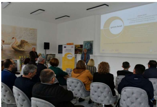
Слика 17 – Прв состанок на Локалната група на засегнати чинители во Радовиш