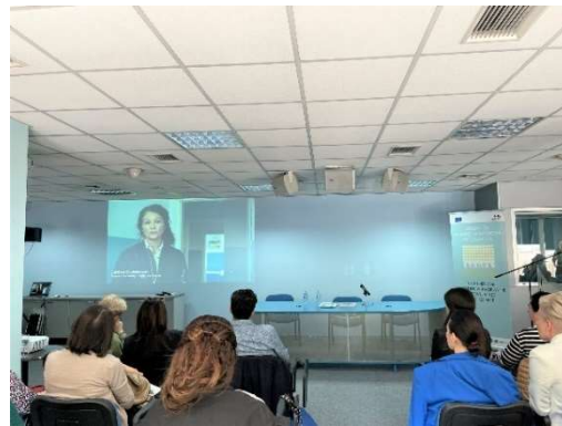
Слика 6 и 8 - Завршен настан на проектот „Заедно за повеќе можности и поддршка – ТИМОР“, простории на Национална и универзитетска библиотека „Св.Климент Охридски“ во Скопје 26.04.2023