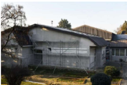
Слика 15 – Мерки за подобрување на ЕЕ на клонот „Цветови“ - детска градинка „Ацо Караманов“ во Радовиш

Проектот е ко-финансиран од Европската Унија, од програмата IPA „EU for Municipalities“ која има за цел пилотирање на иновативни решенија за локалните проблеми во општините, истовремено зајакнувајќи го нивниот капацитет да се справат со нивните надлежности, да ги користат и приспособат најдобрите практични решенија од локалните власти во земјите-членки на ЕУ, како и да ја подобруват вклученоста на локалните чинители во решавањето на проблемите.