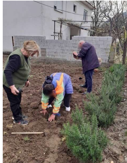
Слика 5 – Дел од окупационите хортикултурни активности во воспоставените станбени единици - април 2023 Демир Капија