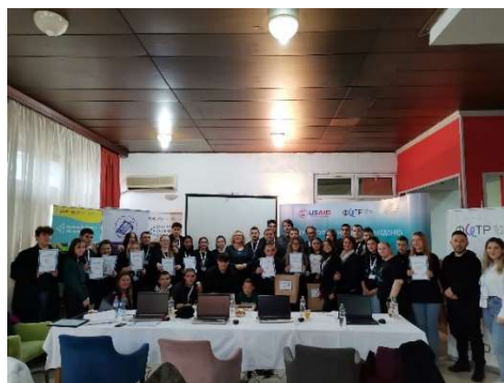
Слика 38 и 39 - Тимот на ЦеПроСАРД, дел од жири комисијата на Кампот за иновации во СУГЦ Лазар Танев во Скопје