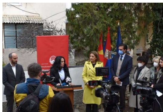
Слика 29 -Отворање на мал групен дом во Велес