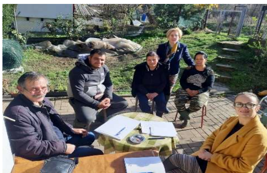
Слика 31 - Теренски активности - мониторинг посети на регантирани организации