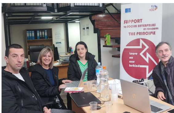
Слика 10 – Мониторинг средба на регрантирана организација Рурална Коалиција