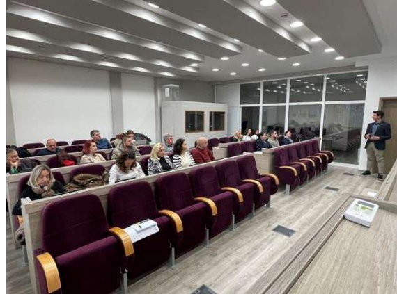
Слика 21 и 22 – Тркалезна маса - Мапирање на ентитети, нивното искуство, капацитети и размена на искуство и идентификување на интерес за соработка за воспоставување на енергетски задруги во општина Медвеџа