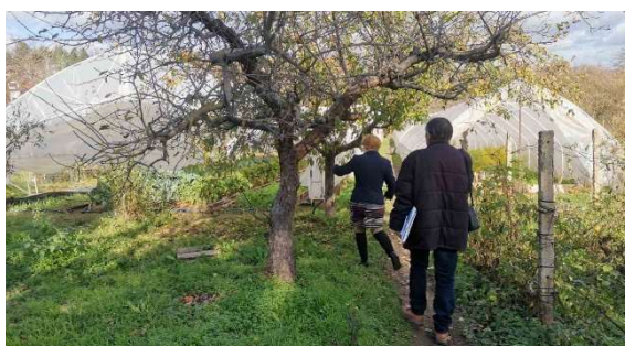
Слика 12 – Теренска посета на регрантирана организација Аквалоника