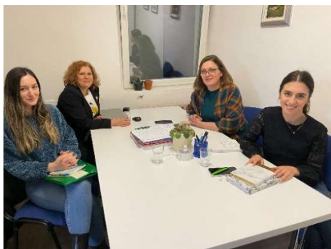
Слика 1 - Работен состанок со избраните консултантки за изработка на публикацијата – Монографија „Заедно за повеќе можности и поддршка – јануари 2023

Во текот на целокупното времетраење на проектот, се стремевме кон сеопфатна инклузија преку подигнување на јавната свест за прифаќање и активно вклучување на лицата со попреченост во сите аспекти на општествениот живот. Изразуваме огромна благодарност до проектните партнери и сите останати вклучени лица и чинители кои дадоа поддршка и свој значаен придонес во успешна реализација на овој проект кој донесе многу позитивни промени во општеството.