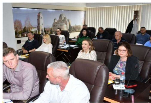
Слика 18 – Трансфер на знаења, искуства и добри практики со претставници од градот Белишче – Хрватска