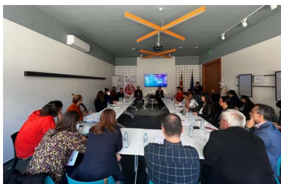
Слика 9 - тркалезна маса „Предизвици и можности за развој на социјалната економија во Република С. Македонија“

Проектот работеше на подобрување на социјалното претприемништво и унапредување на социјалните претпријатија во земјата преку поддршка и вработување на ранливите групи граѓани. На настанот, учесниците имаа можност да ги погледнат успешните проектни активности на ре-грантираните организации, како и беше направена изложба на нивните производи.