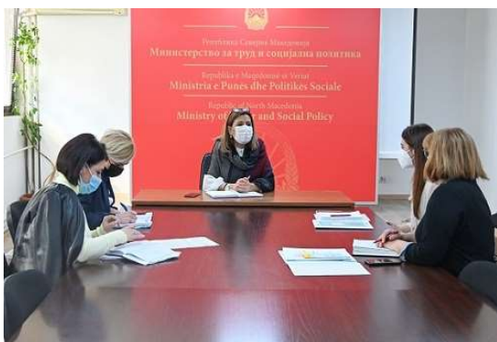
Слика 28 - Состанок во Министерство за труд и социјална политика

Дел од овие информации се презентирани на следните фотографии: