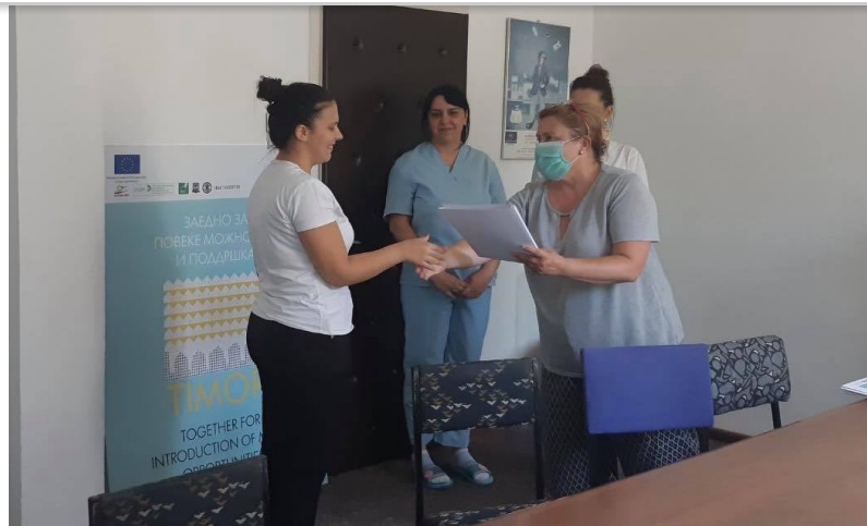
Потпишување на договори за ангажман на 10 асистенти за живеење со поддршка

Проектот има за цел да формира вкупно 10 станбени единици за живеење со поддршка на лица со интелектуална попреченост на територијата на Р. С. Македонија. Во тек е подготовката за преселба на корисниците од Специјалниот Завод Демир Капија, како и изработка на лични планови за 50 корисници.