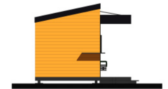
SIDE FACADE 1 M= 1:100